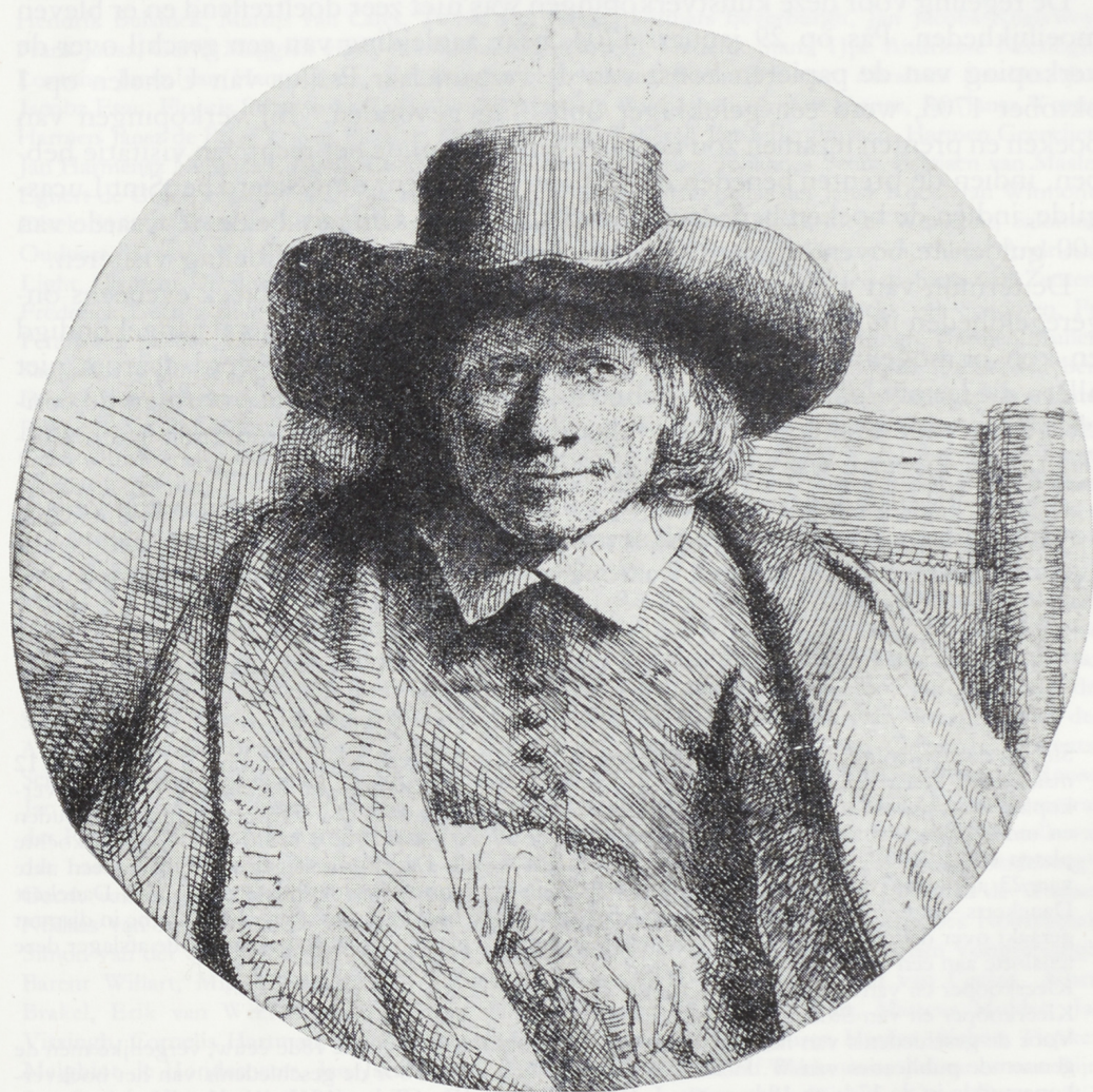
6 Clement de Jonghe, detail van de ets van Rembrandt

Zoals te begrijpen werd de keur van 28 januari herzien. Op 8 juni werden de drie punten gewijzigd. Weer werd ieder vrijgelaten in zijn keuze. Bovendien werd bepaald, dat de verkopenen zouden vallen onder het gilde, waartoe de betrokkene