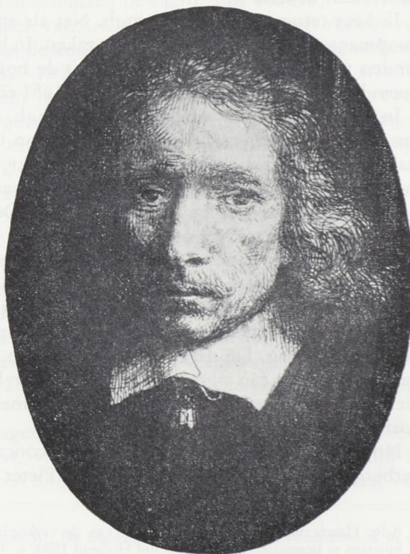
5 'De jonge Haringh', detail van de ets van Rembrandt van 1655

Op zaterdag 25 december 1655 was de eerste verkoping en nog zes andere volgden, vermoedelijk van 27 december tot en met 1 januari 1656. Wie de afslager